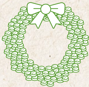
Corona de corchos

En vez de comprar decoraciones, anímate a crearlas reutilizando materiales.